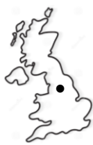
Великобританія Great Britain